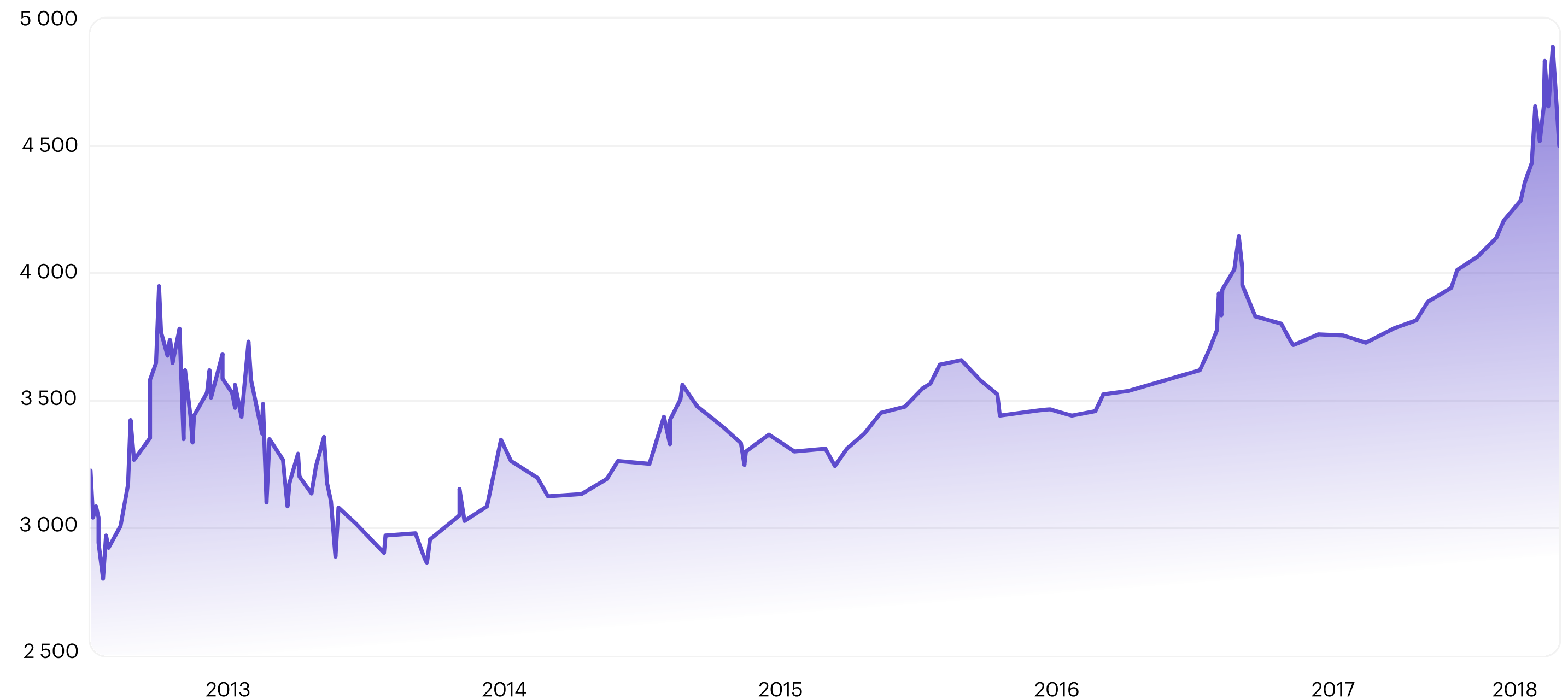
Динамика доллара США против тумана (10 риалов) в санкционные года

Основной пик удорожания валюты пришелся на 2018 г., когда доллар в обменниках вырос в 3,5 раза в течение 10 месяцев. Через год он отошел вниз от тогдашних пиков на 20%.